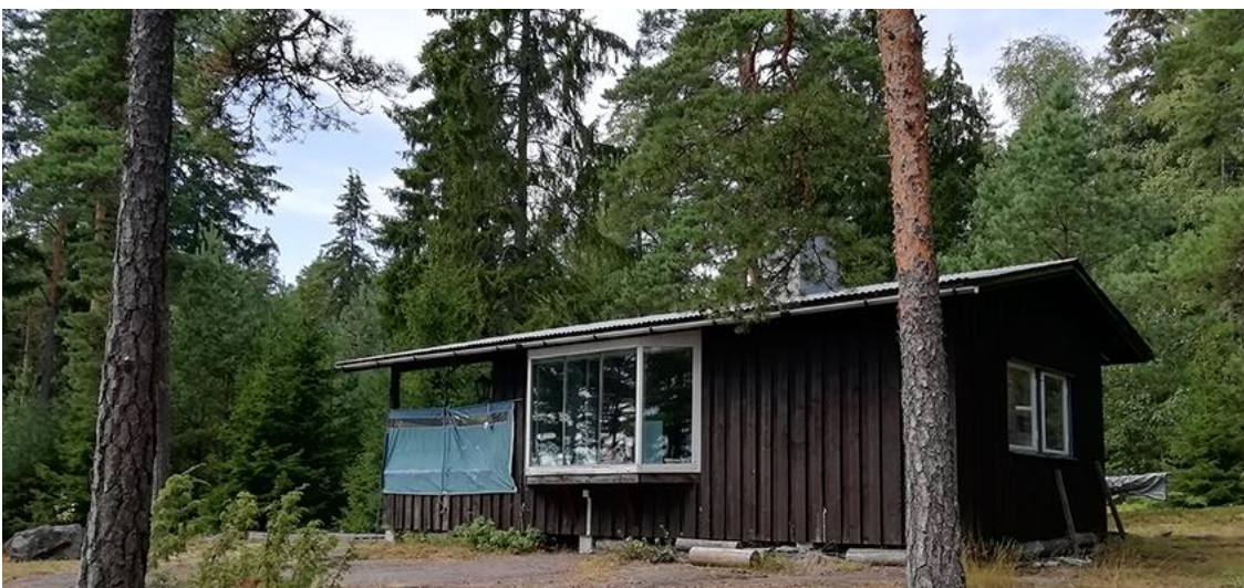
Bild 13. Stugan på byggnadsplats 4 i kvarter 6.