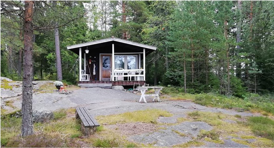
Bild 11. Stugan på byggnadsplats 1 i kvarter 6.