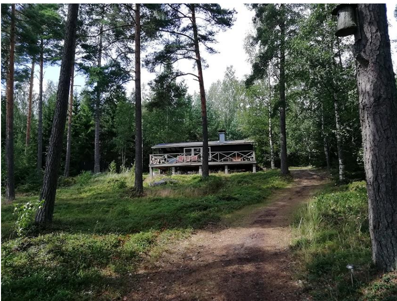
Bild 7. Huvudbyggnaden på byggnadsplats 4 i kvarter 1. I stranden finns bastu..

Till området finns färdiga vägar ända fram till alla bebyggda byggnadsplatser.