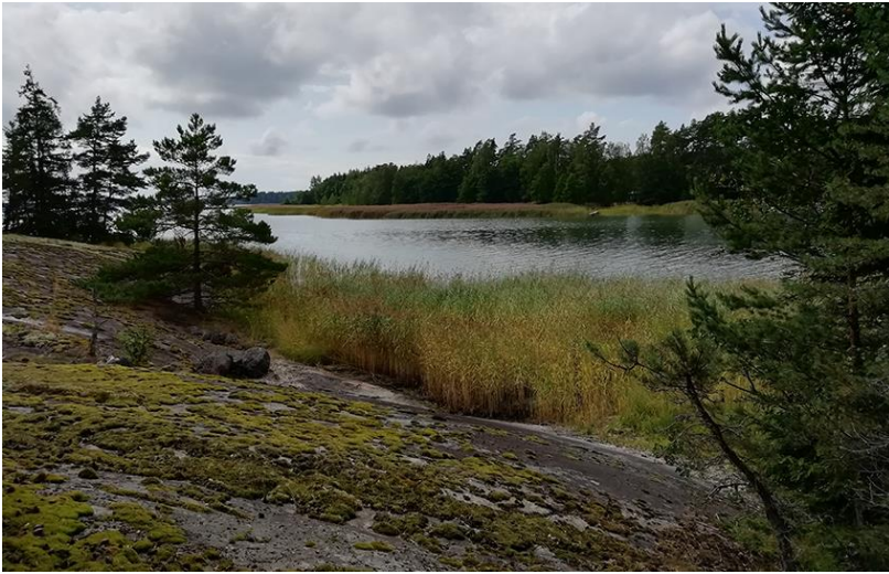
Bild 3. Det kala berget mellan kvarteren 5 och 6 i förgrunden, områdets västligaste strand på andra sidan viken.