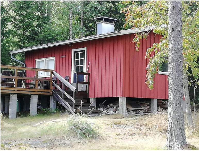
Bild 8. Huvudbyggnaden i kvarter 2. På byggnadsplatsen finns ytterligare bastu och ekonomibygnader.