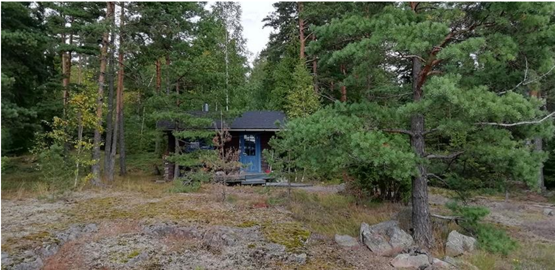
Bild 12. Bastun på byggnadsplats 3 i kvarter 6.