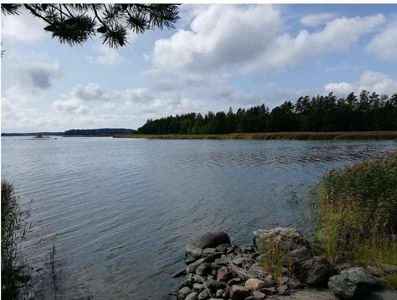
Bild 5. Den västra stranden fotograferad från udden vid byggnadsplats 1 i kvarter 6.