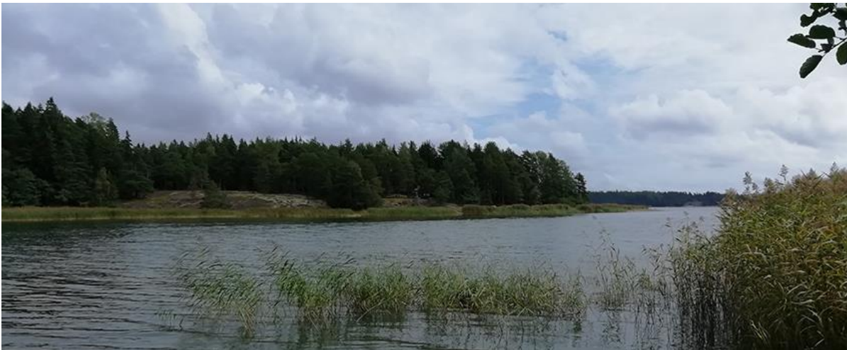
Bild 1. Viken vid Sandarna mot öster. Byggnaden på byggnadsplats 1 i kvarter 6 (bild 11) finns mitt på bilden.

Området är till största delen ekonomiskog med mestadels tall- och granskog. Vid stränderna finns en del lövträd. Stränderna är i den västra halvan av området vassbevuxet och rätt låg. Med tanke på att hela planområdet i generalplanen är anvisat för byggande har ett expertutlåtande inbegärt för att klargöra om området är i behov av en naturinventering för att uppdatera eventuella speciella naturvärden på generalplanens RA-område. Enligt utlåtandet föreligger inte sådana behov. Utlåtandet är givet av biolog Mikko Siitonen och finns som skilt dokument i planhandlingarna, Skatanäs lausunto 2019, Mikko Siitonen.