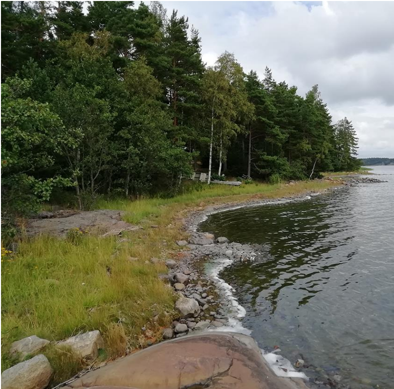
Bild 6. Stranden vid kvarter 6 mot öster.