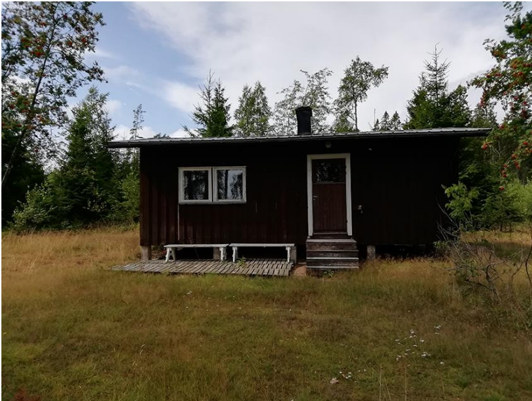
Bild 9. Stugan i kvarter 3.