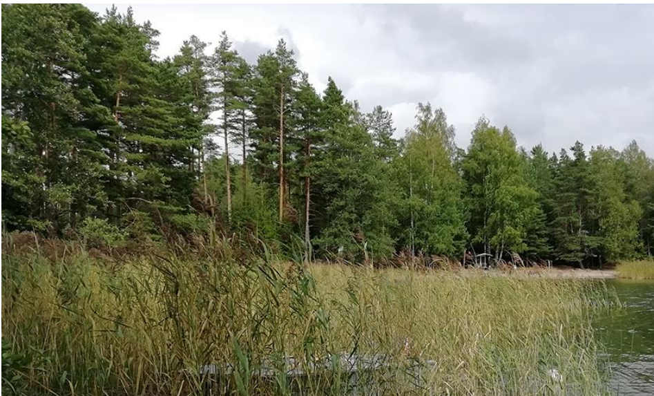
Bild 2. Det inre av viken vid Sandarna med stranden framför kvarter 4.