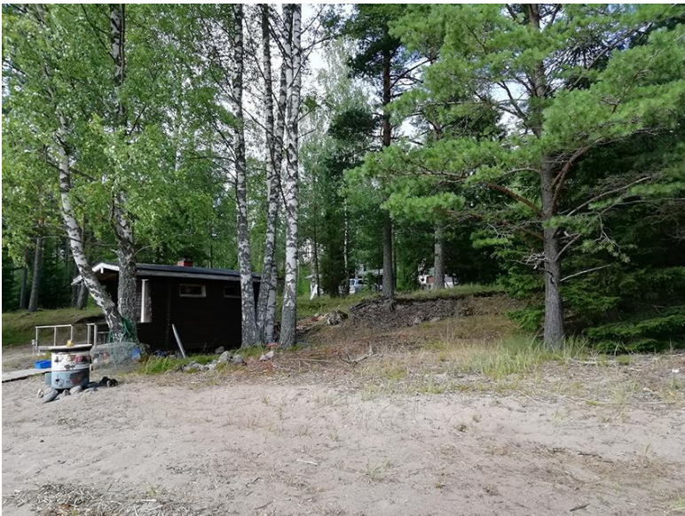
Bild 10. Byggnaderna i kvarter 4, huvudbyggnaden bakom träden i bakgrunden.