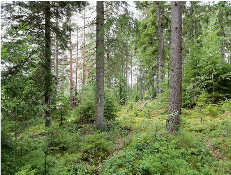
Bild 4. Typisk ekonomiskog i områdets västra del.