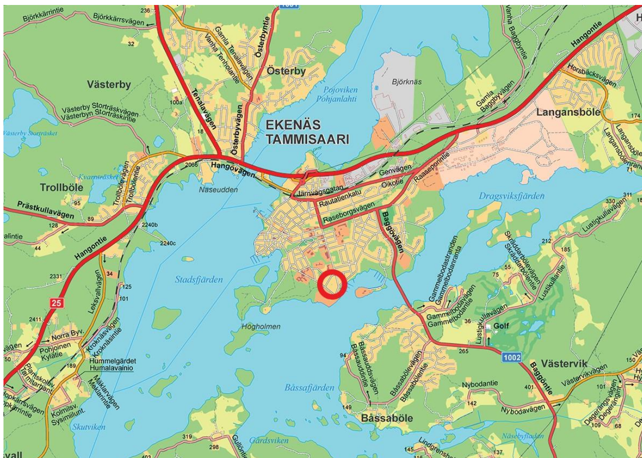
Bild 1. Planområdets läge