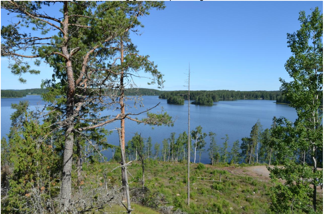
Utsikt från Bråtan över Lojo sjö mot nordväst

Den på Bråtan belägna delen av planeringsområdet är skogbevuxen och sluttar i huvudsak mot nordväst. Den på Västerudden belägna delen av planeringsområdet är skogbevuxen och rätt brantsluttande mot norr, öster och söder. En naturinventering och en arkeologisk inventering görs över planeringsområdet sommaren 2014.