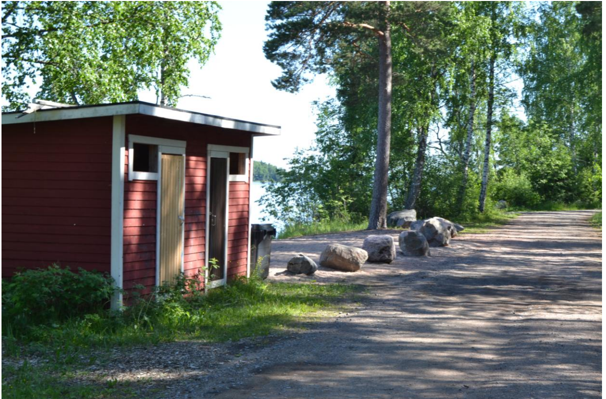
Omkädningsutrymme vid Bråtan simstrand